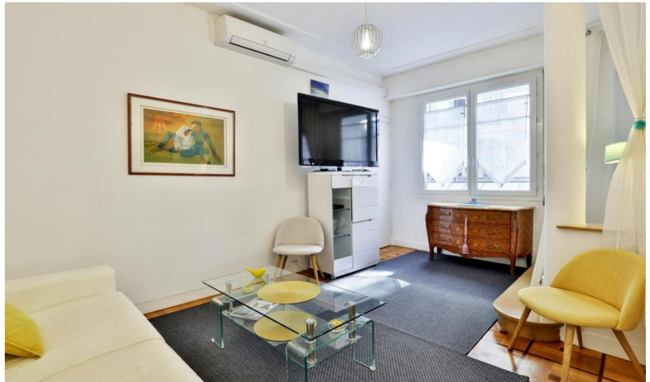
Apartment 23107 Nice